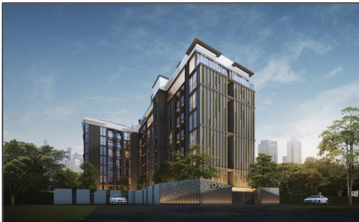
รูปที่ 2.3.1-1 แบบจำลองอาคารโครงการ

อาคารชุดพักอาศัยของโครงการเป็นอาคารคอนกรีตเสริมเหล็กขนาด 8 ชั้น จำนวน 1 อาคาร มีความสูง 22.95 เมตร (ความสูงวัดถึงระดับพื้นชั้นดาดฟ้า) มีจำนวนห้องชุดพักอาศัย 124 ห้อง และมีที่จอดรถยนต์ 42 คัน ดังรูปที่ 2.3.1-1